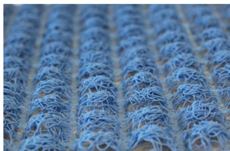
Mortairvent® (0.40 in. / 10 mm)